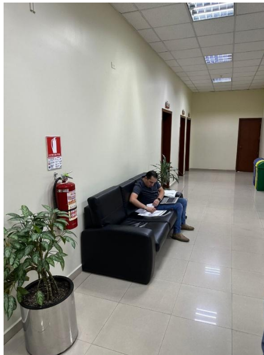
PLANTA BAJA – EDIFICIO ECU 911