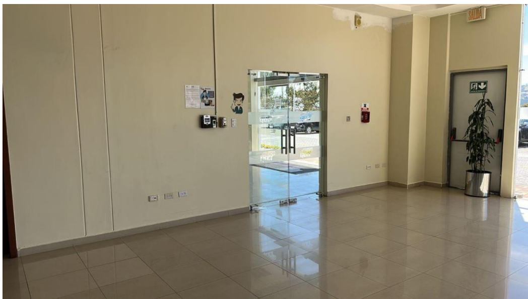
SUBSUELO – EDIFICIO ECU 911